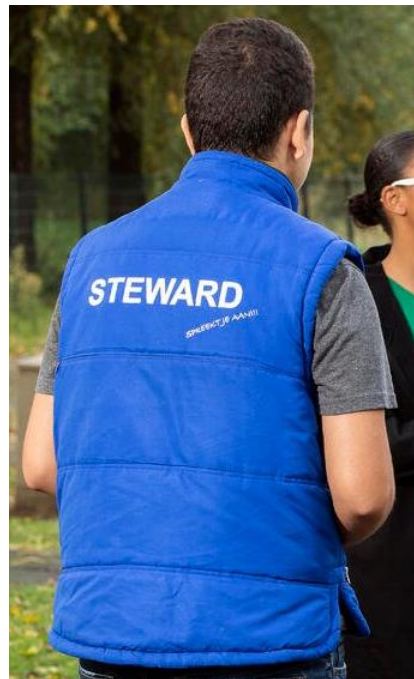
De schoolsteward spreekt je aan!