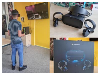
Aan de slag met de VR-bril!

Onze VR set Oculus Rift is vorige week eindelijk gearriveerd. Nu kunnen onze leerlingen leren middels virtual reality real life situaties te simuleren, VR games te programmeren en natuurlijk ook verschillende VR games spelen op de D&P ICT afdeling!