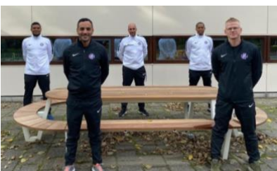
De sectie LO op het ZWC