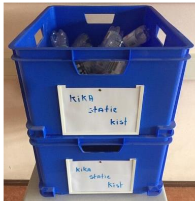
Kika-statiekist in lokaal H2.08