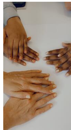
En daarna een fijne manicure!