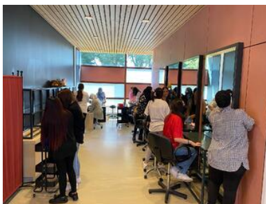
Aan de schoonmaak in de kapsalon!

Er wordt druk geoefend met het helpen van onze eigen klanten in de nagelstudio en kapsalon. En daarnaast is de boel ook weer lekker opgefrist!